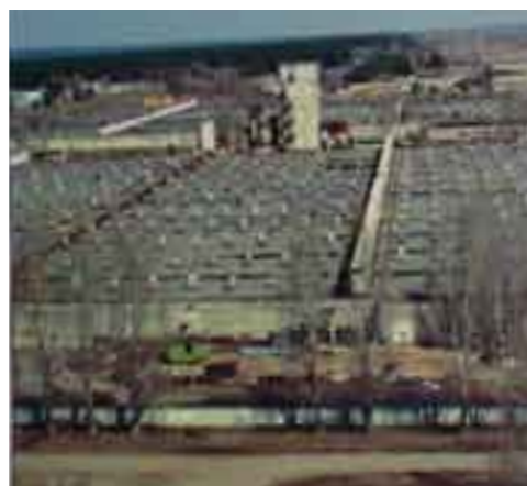
Laut Aussteller ist derzeit eine Anlage für 150.000 Mastschweine geplant. - Die Prioritäten werden anders gesetzt in ungesättigten Märkten.