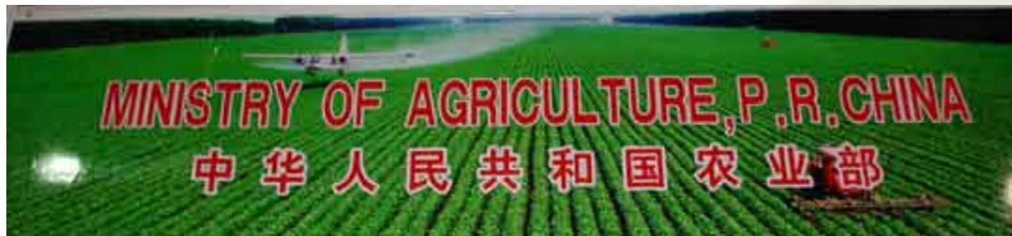
China wirbt mit schlagkräftiger Agrarindustrie. Ob der Arbeiter im Traktor wohl eine Atemschutzmaske trägt?