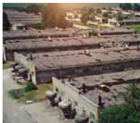
Im Bild links ein russisches Schweinezuchtwerk mit 64.000 Mastplätzen